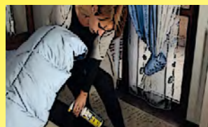
In salotto su divani, cuscini e poltrone