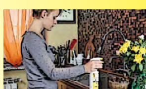
In cucina avendo cura di spostare gli alimenti