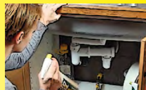
In sottolavandini e bagni