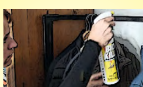
In armadi e ripostigli