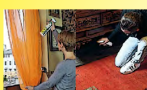
Su tende e tappeti